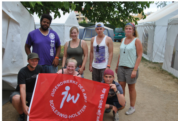
Ferienfreizeitteam Spanien 2012

Sie sollen bei der Gestaltung des gesellschaftlichen Lebens mitwirken und ihre Interessen und Rechte wahrnehmen lernen.